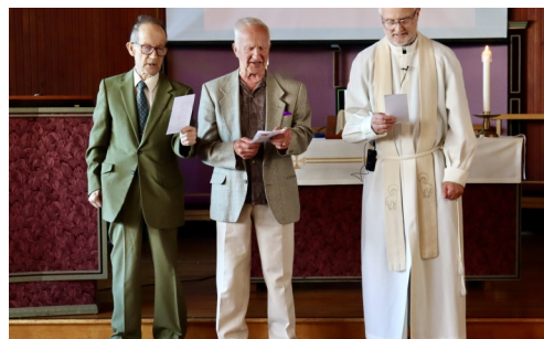
Mother's Day Trio :)