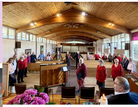
Ystävänäpäivän kirkko Emmauksessa 15.2. Celebrating Valentine's Day at Emmaus with the Choir!