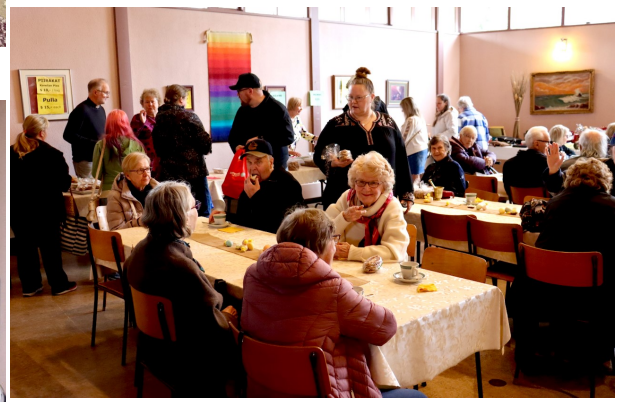
Spring Bazaar at Emmaus March 28 Thank you all the participants, donors, volunteers & Finngoods.