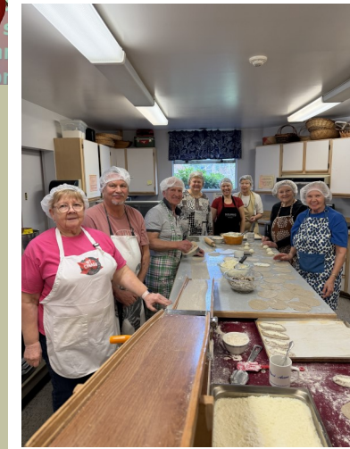
Karelian Pastry Bakers

Talvisodan päättymisen-päivän jumalanpalvelusta vietettiin Emmauksessa 15.3.2026. Kiitos kuorolle ja kaikille esiintyjille ja osanottajille! Kiitokset naisille tarjoilusta! Commemorating the end of the Winter War Church service March 15.