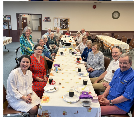
West Kelowna service May 20—with coffee and fellowship!