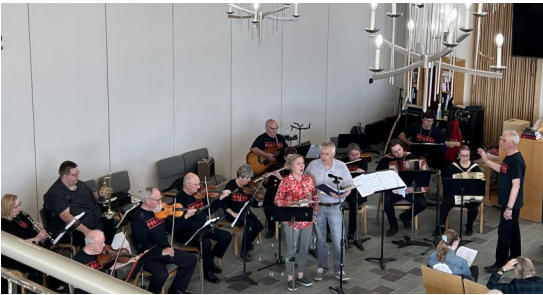
Thunder Bay pelimanni-orkesteri ja konferenssin juhlakuoro